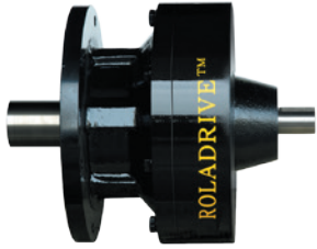
KVD Vertical double shaft type one stage reducer 一段型 立式雙軸型 減速機